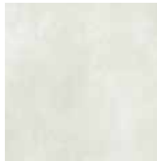
ARGENTA Porcelanico antideslizante 60x60 cm.