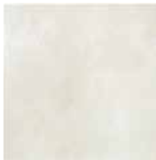
ARGENTA Porcelanico 60x60 cm.