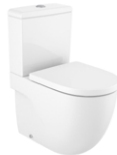
INODORO MERIDIAN ADOSADO A PARED de Roca