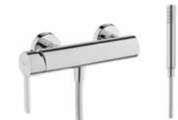
GRIFERÍA DUCHA MONOMANDO de Gala