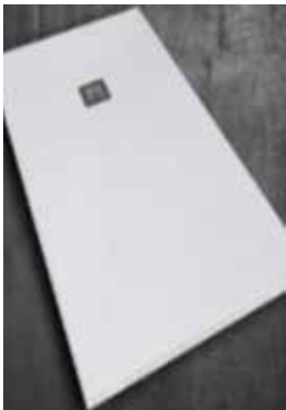
PLATO DE DUCHA Oporto