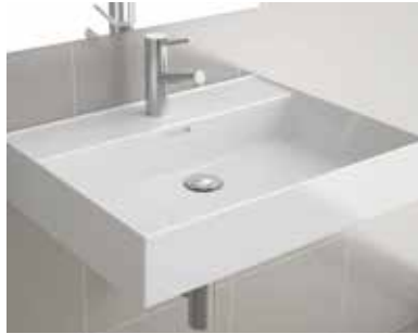
Baño 1. VENETO 1 SENO 1010/810 + MUEBLE SPIRIT BLANCO BRILLO