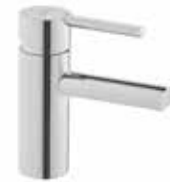
BALANCE MONOMANDO. LAVABO VÁLVULA CLICK-CLACK Y SIFÓN CROMADO de Gala