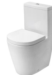
Acro Compact toilet Inodoro Acro Compact