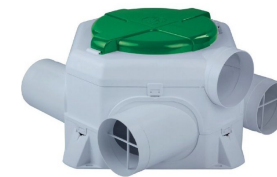
Mechanical ventilation system Sistema de ventilación mecánica