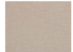
Textil Cactus textile Textil Cactus textile