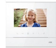
Videoportero Video intercom