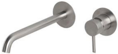
Concealed shower deck shower system.