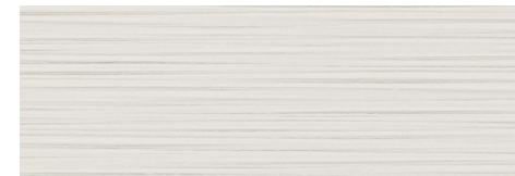
Second bathroom Decorative Limit Vela Natural Porcelanosa 33,3 x 100 cm