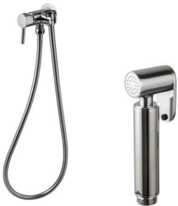
Round stainless steel single tap shower set

Monomando set ducha sanitaria Round inox