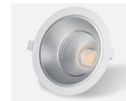
Downlight led CELER