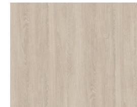
Doors Smoked Oak Puertas Roble humo