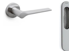
Olivari fittings LAMA model Satin-finish chrome