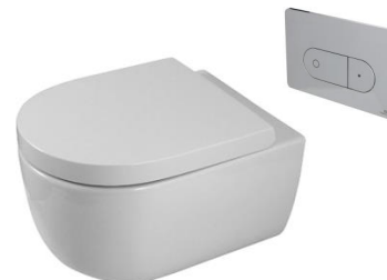
Acro Compact suspended toilet Inodoro suspendido Acro Compact