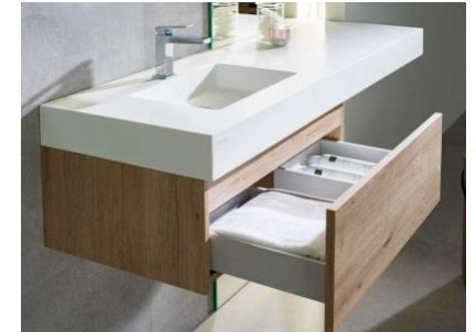
ONE Kole hanging unit