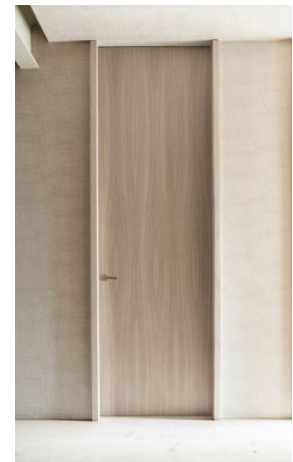
Herrajes Olivari Modelo LAMA Cromo satinado