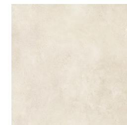
Exterior Gres porcelánico Vela Natural C3 100x100cm