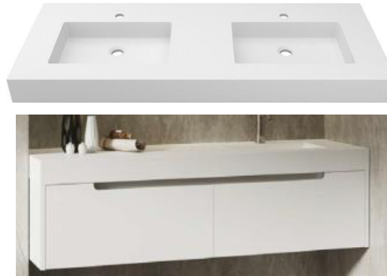
ONE hanging Kole unit Encimera Kole Mueble ONE suspendido