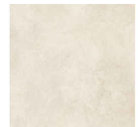
Interior Gres porcelánico Vela Natural 100x100cm