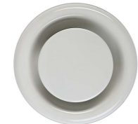
Extractor duct Boca de extracción