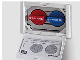
Shut-off valve. Hidden control. Llave de corte mando oculto

Two concealed shut-off valves for hot and cold water in each wet room.