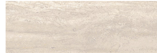
Master Decorative tiles Roma Marfil Porcelanosa 59,6x120cm