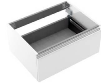
Mueble suspendido bajo lavabo Modelo Spirit de Salgar. Color blanco brillo Gloss white Spirit wall-mounted cabinet by Salgar