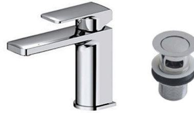
Grifería lavabo monomando modelo NK Concept de Porcelanosa KN Concept Mixer type by Porcelanosa