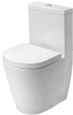
Inodoro a suelo adosado a pared. Modelo Acro Compact de Porcelanosa Toilet floor-mounted against wall, Acro Compact model by Porcelanosa