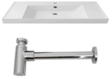
Lavabo suspendido de un seno Modelo ONE - 1000 x 500 mm de Porcelanosa Single wall-mounted ONE Model - 1000 x 500 mm by Porcelanosa