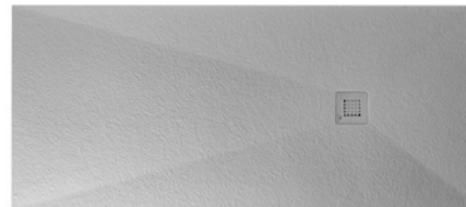
Plato de ducha modelo Slate de Porcelanosa Slate model shower tray by Porcelanosa