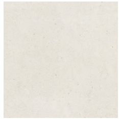
59,60 x 59,60 cm. Mod. Matika Bone de Porcelanosa

En los baños el pavimento será el mismo que en el resto de la vivienda. Gres porcelánico rectificado formato 59,6x59,6 cm modelo MATIKA BONE de PORCELANOSA. Las paredes que no vayan alicatadas llevarán rodapié a juego con el pavimento.